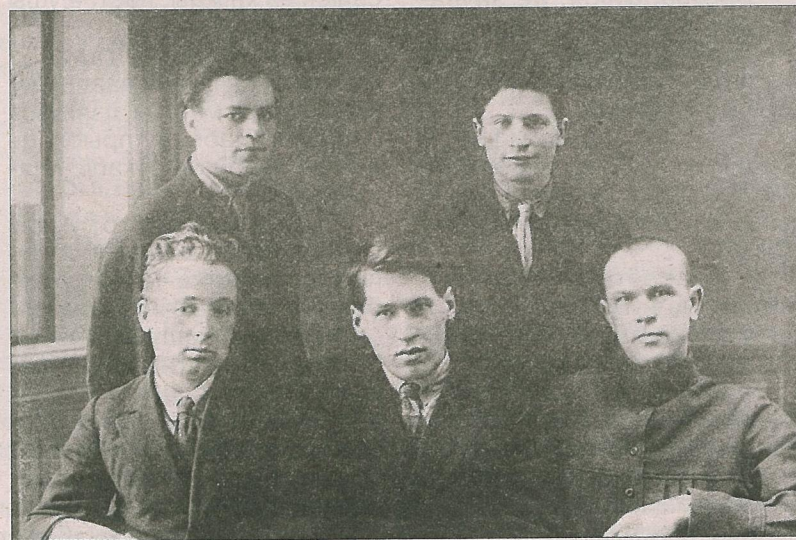
Рэдакалегія часопіса «Узвышша», 1927 г.