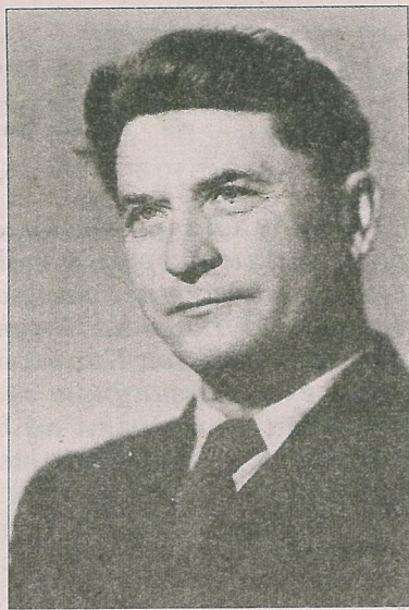
Язэп Пушча ў другой палове 1950-х гг.