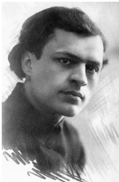
Адам Бабарэка. 1925 год.

Ён мала пражыў, але за кароткі тэрмін працы паспеў аказаць вялікі ўплыў на развіццё беларускай літаратуры, намага-