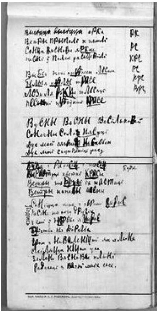
Старонка нататніка Адама Бабарэкі.

Але і ў высылцы пісьменнік адчуваў сваё прызнанне і прызначэнне, неабходнасць напісання крытычных артыкулаў і арганізацыі літпрацэсу: пісаў літаратуразнаўчыя і філасофскія доследы. Вялікую частку другога тома збору твораў займае яго эпістальярная спадчына: лісты да жонкі, сям'і і сяброў — Уладзіміра Дубоўкі, Язэпа Пушчы і Антона Адамовіча з высылкі.