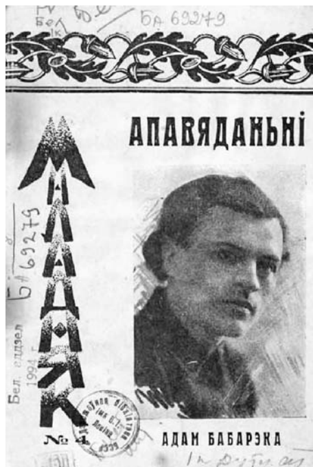
«Апавяданні» (1925).