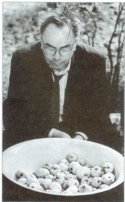
Ян Скрыган – роздум над дарам прыроды. Мінск. 1970-я гг.

З архівазнаўчага гледзішча найбольш цікавыя і каштоўныя, мабыць, тыя запрашэнні, на якіх Ян Скрыган пакінуў сваёй рукой нейкія запісы, пазнакі. На адным з іх пісьменнік, напрыклад, выпісаў у слупок варыянты націскаў у некаторых словах: “Прахор – Прохар, Сідор – Сідар, зайцоў – зайцаў, цыганоў – цыганаў, каталікоў – католікаў, каштаноў – каштанаў, палякоў – палякаў, халатоў – халатаў”. Яшчэ на адным можна разгледзець любоўна, мілосны, цукерня, несамавіты – самавіты... Вядомая любоў Яна Скрыгана да слова, яго асабліва ўвага да гучання роднай мовы праявілася і тут.