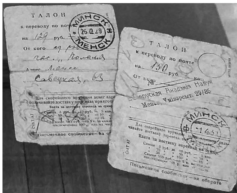
Талоны для пераводу грошай за публікацыі. З фонду ДМГБЛ.

Асабліва цікавыя артыкулы Бядулі надрукаваны часткамі ў «Савецкай Беларусі» ў 1922 годзе: «Рэлігія і беларускае сялянства», «Паншчына ў беларускіх песнях і казках», «Класавыя матывы ў беларускай народнай творчасці». Пазней яны склалі працу «Вера, паншчына і воля ў беларускіх народных песнях і казках» (1922), выпушчаную выдавецтвам «Савецкая