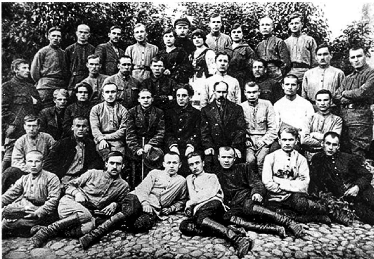
Змітрок Бядуля і Якуб Колас (у цэнтры) сярод студэнтаў рабфака БДУ, 1922 год.

Беларусь». У фондзе НББ знаходзіцца экзэмпляр гэтай кнігі з дарчым надпісам ад аўтара гісторыку У. І. Пічэту, які ўзначаліў адкрыты ў 1921 годзе Беларускае дзяржаўнае ўніверсітэт.