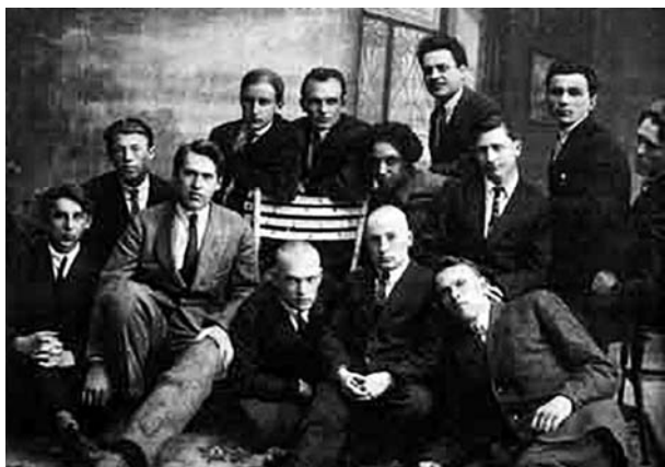
«Узвышша». 1928 год.