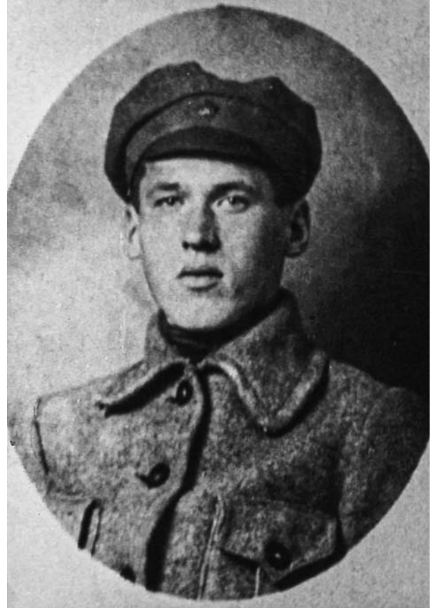
Дубоўка — чырвонаармеец. 1921 год. З фондаў БДАМЛіМ

Бездакорнае валоданне заканадаўчай базай (ці дарэмна шэсць гадоў кожную літару закона перакладаў?), ветлівасць і хуткі розум, багаты сялянскі досвед, да таго ж валоданне англійскай мовай. Для богам забытага сібірскага кутка гэта быў сапраўдны скарб