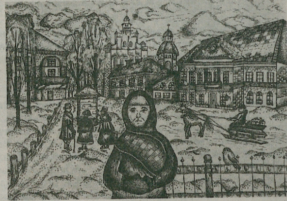
Малюнак Дар'і Бондар «На Каляды да сына» з конкурсу.

Сёлета быў абвешчаны мастацкі конкурс сярод школьнікаў «Змітрак Бядуля — мастак слова». Толькі нядаўна скончылі збіраць заяўкі.