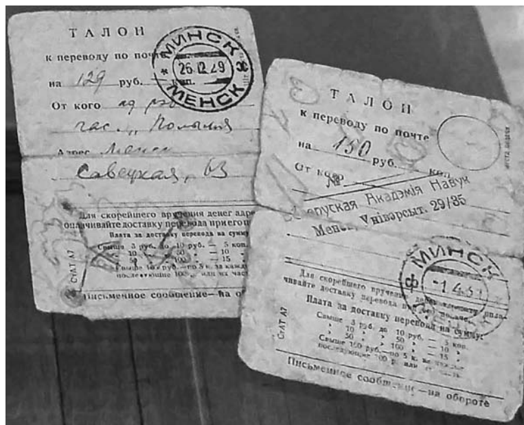
Талоны для пераводу грошай за публікацыі. З фонду ДМГБЛ.

Асабліва цікавыя артыкулы Бядулі надрукаваны часткамі ў «Савецкай Беларусі» ў 1922 годзе: «Рэлігія і беларускае сялянства», «Паншчына ў беларускіх песнях і казках», «Класавыя матывы ў беларускай народнай творчасці». Пазней яны склалі працу «Вера, паншчына і воля ў беларускіх народных песнях і казках» (1922), выпушчаную выдавецтвам «Савецкая