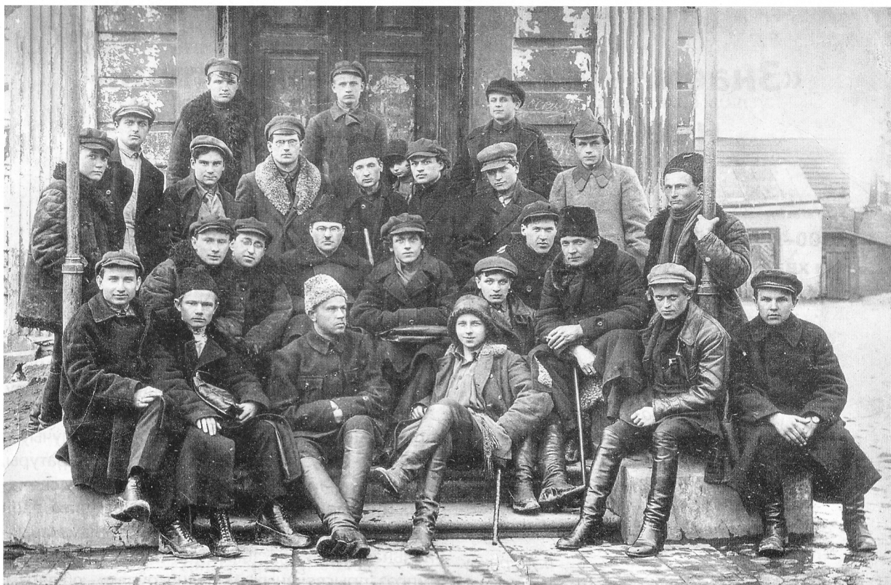
Пленум ЦК «Маладняка». 21–23 сакавіка 1925 года.

цыянальнага адраджэння. Напрыклад, Гродзенскі гурток беларускай моладзі (1909–1913), сярод удзельнікаў якога была Людвіка Сівіцкая (Зоська Верас). У нейкай ступені творчыя аб'яднанні «Маладняк» і «Узвышша» сталі працягам усеагульнай моды на гурткі і таварыствы, якія пачалі з'яўляцца яшчэ ў першыя дзесяцігоддзі стагоддзя. Хваля беларусізацыі 1920-х станоўча паўплывала на развіццё беларускай літаратуры, што патрабавала фарміравання арганізацыйнасці літаратурнай справы. Такім чынам, узнікае «Маладняк» як адказ на гэтыя патрэбы.