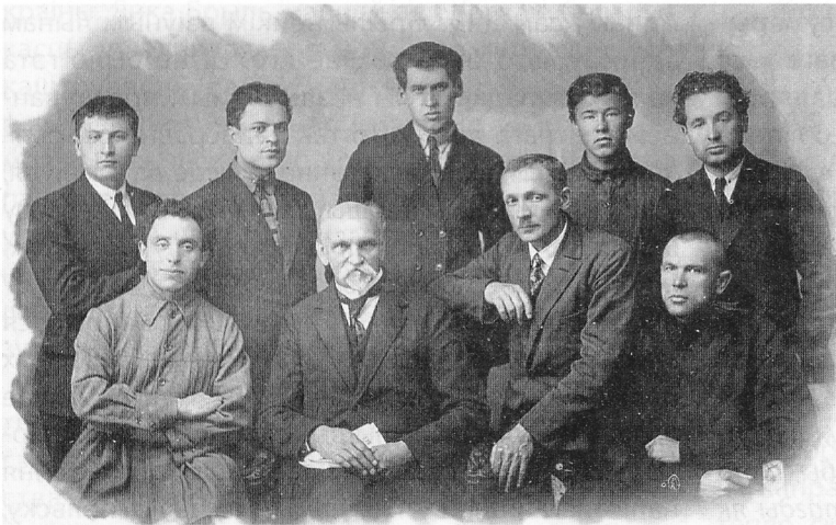
Беларускія пісьменнікі на сустрэчы з Янам Райнісам. Першы справа сядзіць Кандрат Крапіва, стаіць пасярэдзіне — Уладзімір Дубоўка. На фота можна знайсці Я. Пушчу, Я. Купалу, З. Бядулю і іншых. 19 лістапада 1926 года. З фондаў БДАМЛМ.

ноч». У СССР яны выдаваліся да расстрэлу Валерыя Мараква і пасля яго рэабілітацыі. Крытыкі называлі яго «сэрцам, сагрэтым сумам», «паэтам эмоцый», «растаптанымі пялесткамі». Сямнаццацігадовы падлетак стаў вядомым беларускім паэтам адразу пасля выхаду першай кнігі «Пялёсткі», а выдаўшы праз год новую — «На залатым пакосе» — зрабіўся адным з куміраў маладых чытачоў. Больш падрабязна пра Валерыя Мараква і працу над раздзелам праекта, прысвечаным яго жыццю і творчасці, вы даведаецеся ў наступным нумары часопіса. ❖