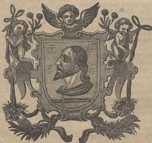
Герб г. Віцебска 1597 г.