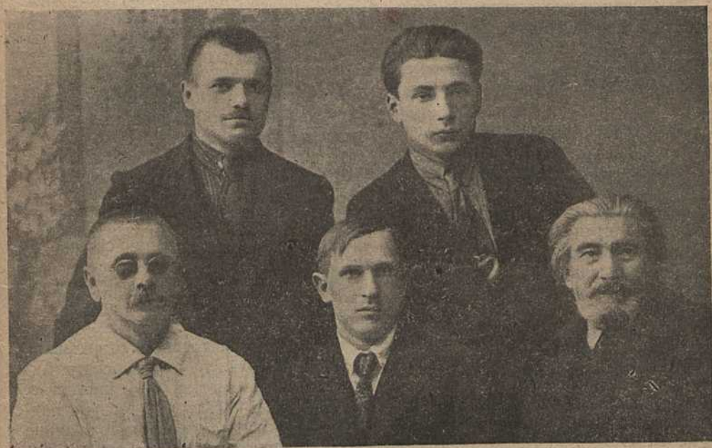
Першае Праўленьне Таварыства.

Ужо адбыўся адзін сход новага Праўленьня.