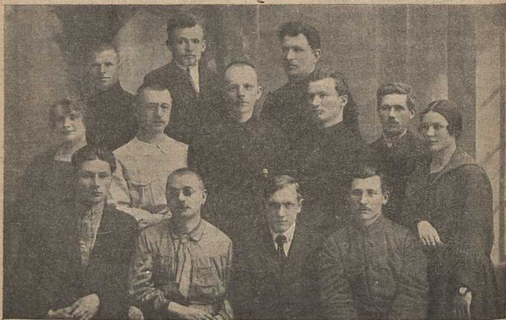
Першая гістарычна-мастацкая экскурсыя па Віцебску.

Дзе трэба было Таварыству йшлі на дапамогу. Так, пашыраны пленум Акруговага Камітэту КП(б)Б. пастанавіў пасіліць Таварыства марксыцкімі сіламі й дапамагчы ў выданьні прац Таварыства. Пашыраны пленум Акруговага Спаўняючага Камітэту прыняў такую-ж пастанову. Сэкцыя навуковых працаўнікоў Саюзу Працасьветы ўнесла ў плян свае працы ўдзел у працы Таварыства. Адзін час камісія Таварыства працавала ў Аддзяленьні