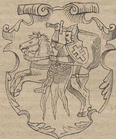
Герб Віцебскага ваяводства.

да ўплыву на быт, але й наагул да ўсякай зразумелай чалавечай дзеяльнасці. Трэба ведаць, у якім напрамку існуючае прыстасоўваецца, каб атрымаць магчымасьць прымаць удзел у будаванні быту. Для таго, каб падняць культуру на больш высокую ступень, працоўнай клясе трэба прадумаць свой быт, а дзеля гэтага пазнаць яго».