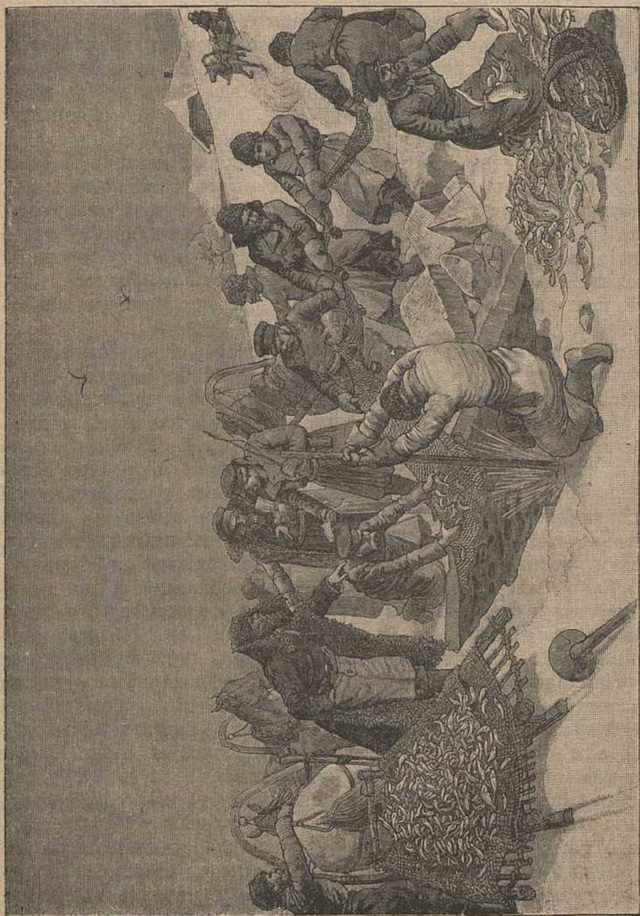
Рыбны лоў у Відебшчыне.