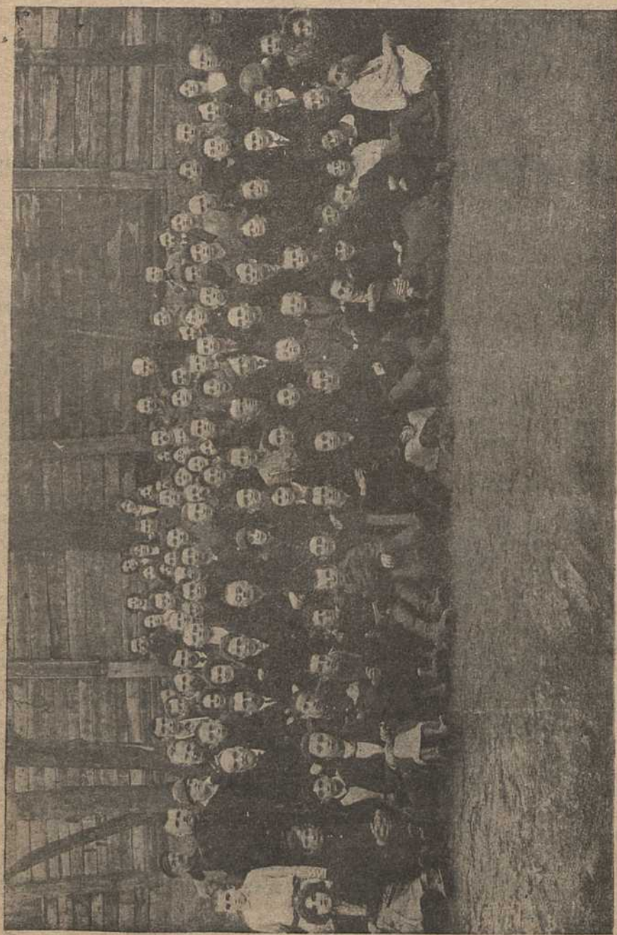
Краязнаўчая Конфэрэнцыя 26—27 красавіка 1925 г.