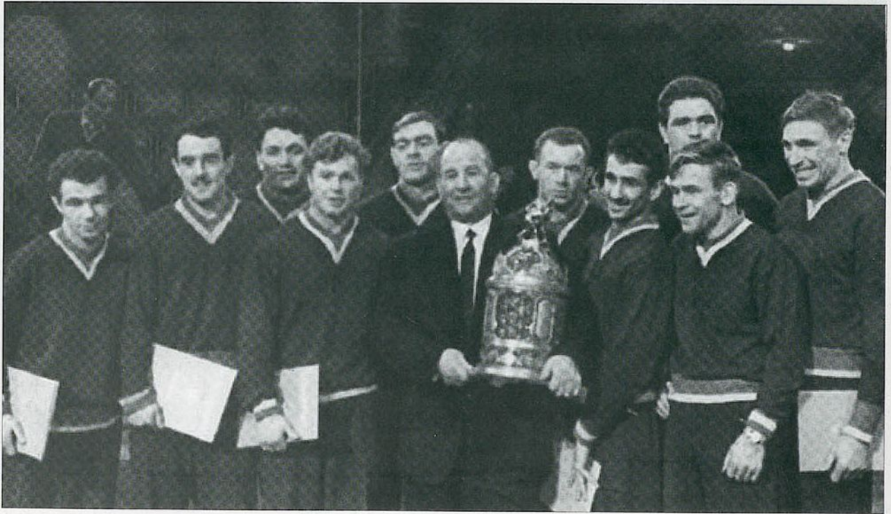
1960 год. Важнейшее событие в истории спортивной борьбы Белоруссии.

Кубок командного первенства СССР в надежных руках. Ура!!!