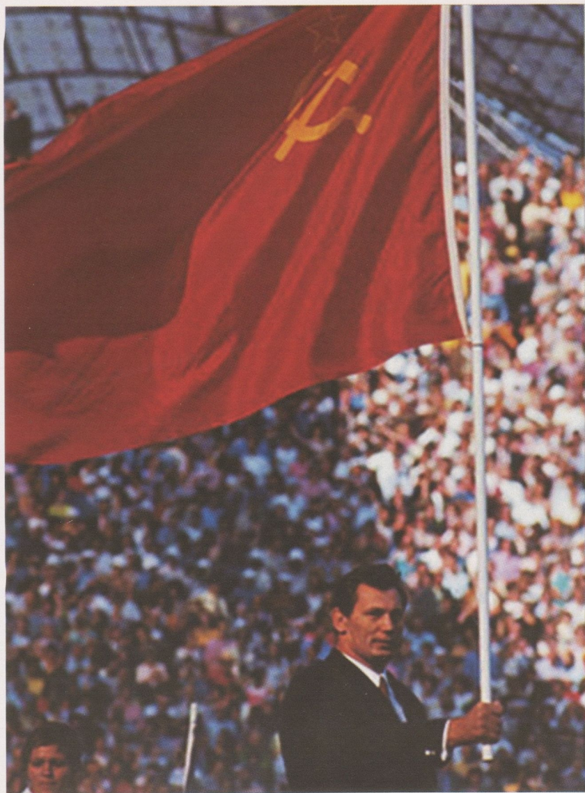
Олимпийские игры 1972 года. Мюнхен, ФРГ.

главе колонны на Олимпиаде в Мюнхене. Цитата: «Русский богатырь с говорящей фамилией к тому моменту был уже двукратным чемпионом Олимпийских игр, а потому никто и не удивился, когда почетное право выйти на стадион первым среди советских спортсменов было отдано именитому тяжеловесу. В Германии Медведь выиграл свою третью золотую медаль подряд и стал одним из самых титулованных знаменосцев в истории, затмив соотечественников Власова и Жаботинского, которые выиграли лишь по две высшие награды».