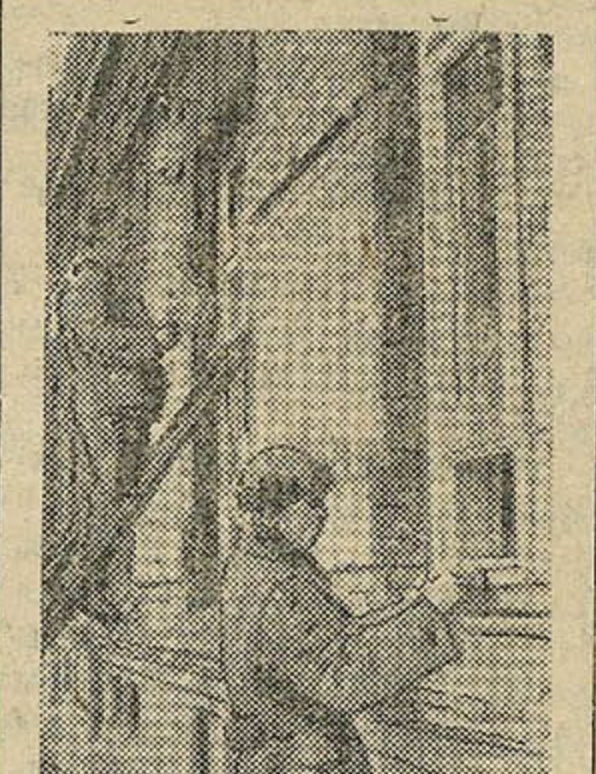
Брыгадзёр тав. Куляшоў і шкляр тав. Маслоўскі заканчваюць аднаўленне заводскай сталовай. Фото Л. Папковіча.

Зайшоў я ў электрасілавы цэх, і самі слёзы сплюсца: усё разбурана, ад светлага, чыстага,